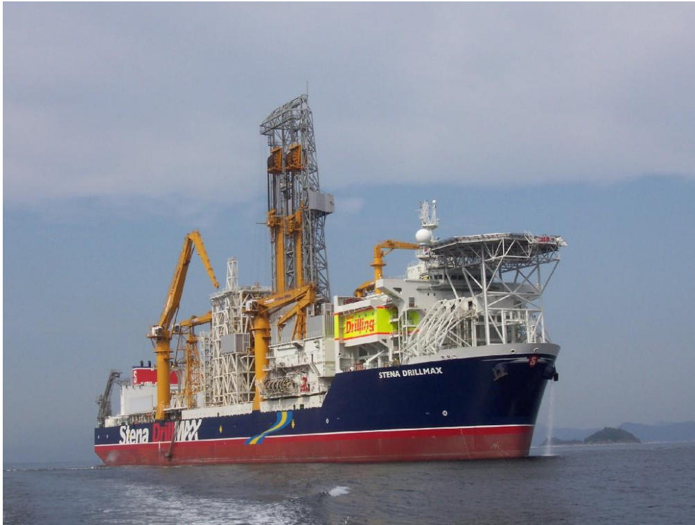
De Stena Drillmax.